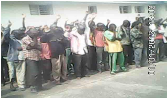
Les prisonniers prennent la decision de se repentir