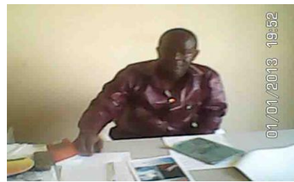
Le Directeur dans son bureau