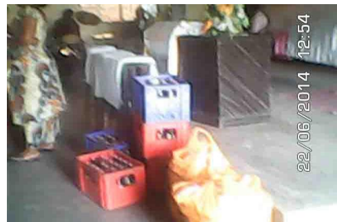
A un prisonnier le droit d'une bouteille de Sucré et du pain