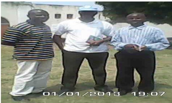
L'agent de la MONUSCO au milieu de deux pasteurs