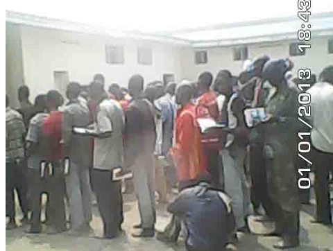
Dans le culte le pasteur distribue la littérature l'enfer