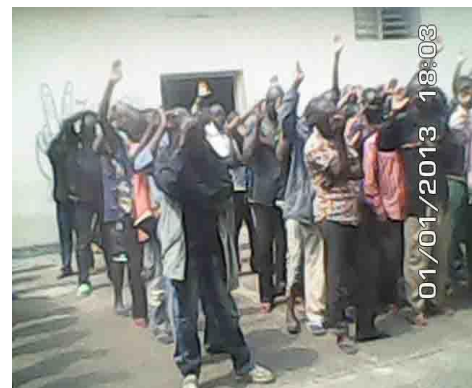
Prise de la decision de suivre Jésus