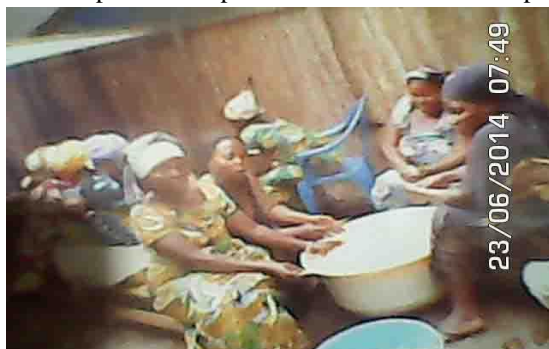
La nourriture en faveur des prisonniers en cuisson