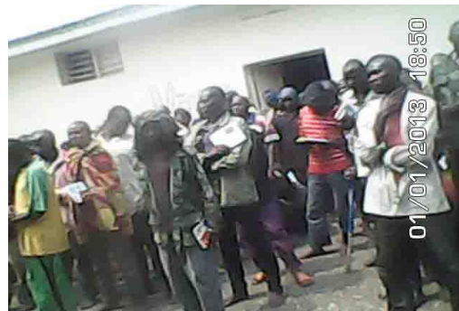
Les prisonniers écoutent la parole de Dieu