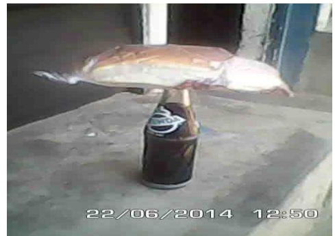
un fanta et du pain