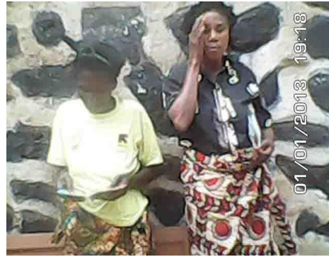
Cette femme donne le témoignage de sa vie